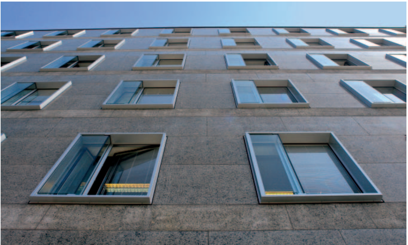
Vom Effekt der Verbindung von Sonnenschutz mit harmonischer Lichtlenkung profitieren die Mitarbeiterinnen und Mitarbeiter eines Münchner Bürogebäudes.

Das System bietet aber nicht nur perfekten Wärmeschutz, sondern spart zudem auch noch Geld, denn beim Einbau einer außen liegenden Sonnenschutzanlage müsste diese zwangsläufig mit Strom angetrieben werden – für den Kunden ein nicht unerheblicher zusätzlicher Kostenfaktor. Die in den Fenstern des Bürogebäudes Sonnenstraße 21 ein-